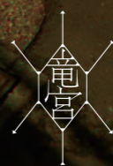
デザイン: 津山勇(ヤング田)

空間演出 L PACK | 小田桐英と中嶋哲矢によるカフェユニット。バックパックに詰めたカフェを様々な場所で開封し「コーヒーのある風景」をつくりだす。コーヒーを媒体とした出会いやコミュニケーションの誘発と、臨機応変な空間演出により、まちの要素のひとつになることを目指す。2007年より活動をはじめ、アート、デザインの展覧会、ワークショップやイベントに参加。